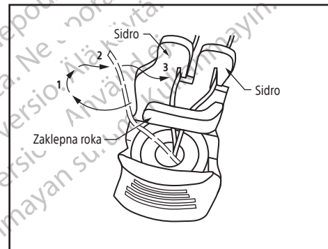
Slika 2. Sidro za zaklepanje pripomočka